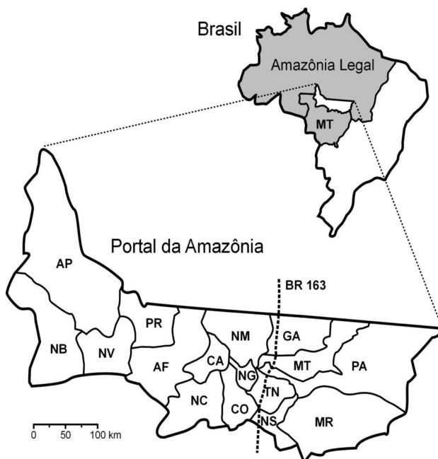
Figura 1 - Mapa do Portal da Amazônia. O Portal da Amazônia encontra-se no Estado de Mato Grosso (MT), na região da Amazônia Legal, no Brasil. Ver material e métodos para a legenda dos nomes dos municípios.

As entrevistas foram realizadas entre julho e dezembro de 2006 nos 16 municípios do Portal da Amazônia: Alta Floresta (AF), Apicás (AP), Carlinda (CA), Colíder (CO), Guarantã do Norte (GA), Marcelândia (MR), Matupá (MT), Nova Bandeirantes (NB), Nova Canaã do Norte (NC), Nova Guarita (NG), Nova Monte Verde (NV), Nova Santa Helena (NS), Novo Mundo (NM), Paranaíta (PR), Peixoto de Azevedo (PA), Terra Nova (TN). O critério para a escolha dos indivíduos a serem entrevistados seguiu a metodologia da “bola de neve” (Scott 2000), que consiste em entrevistar um número inicial de atores para identificar novos atores a serem entrevistados e assim por diante. O grupo inicial de atores a serem entrevistados foi escolhido a partir da lista dos membros do Conselho Executivo das Ações da Agricultura Familiar (CEAAF), que reúne 60 instituições tais como: Conselhos Municipais de Desenvolvimento Rural Sustentável, prefeituras municipais, membros dos movimentos sociais, ONGs locais, sindicatos rurais patronais, sindicatos de trabalhadores rurais, órgãos públicos, entre outros. Esta lista foi escolhida porque os membros do CEAAF têm um papel relevante nas questões